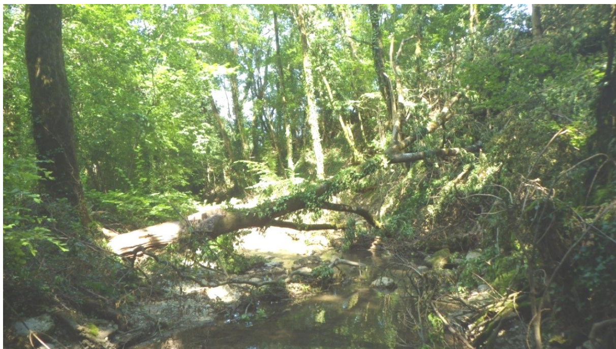
Légende : embâcles sur l'Alloix suite aux tempêtes de l'été 2019

Dans la plaine de l'Isère, les propriétaires fonciers sont historiquement regroupés au sein d'associations syndicales pour assurer cette obligation. Cet entretien est essentiel pour assurer le bon écoulement des eaux et la prévention des risques d'embâcles et de débordements sur des secteurs à enjeux situés plus en aval. L'Unité territoriale du Grésivaudan au SYMBHI apporte son appui et son expertise pour accompagner les riverains du territoire dans leurs démarches (contact : contact@symbhi.fr ).